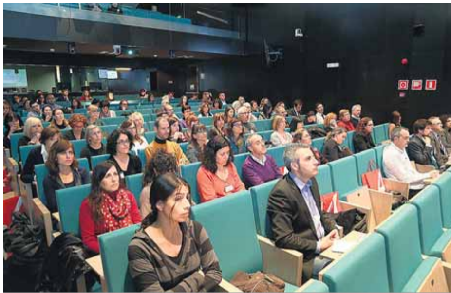
El congrés durant la seva edició de l'any 2014